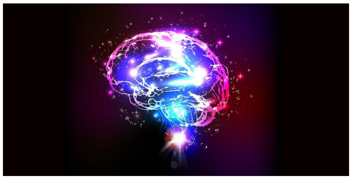
PET 스캔은 뇌의 대사 활동을 측정하는 데 사용됩니다.

PET는 PET 스캔을 사용하여 PET 스캔이 HD 진단에 어떻게 사용되는지 설명합니다. PET는 뇌의 대사 활동을 측정하는 데 사용되며, HD와 관련된 뇌 영역의 대사 변화를 탐지할 수 있습니다. PET는 HD의 진단과 모니터링에 중요한 역할을 합니다.